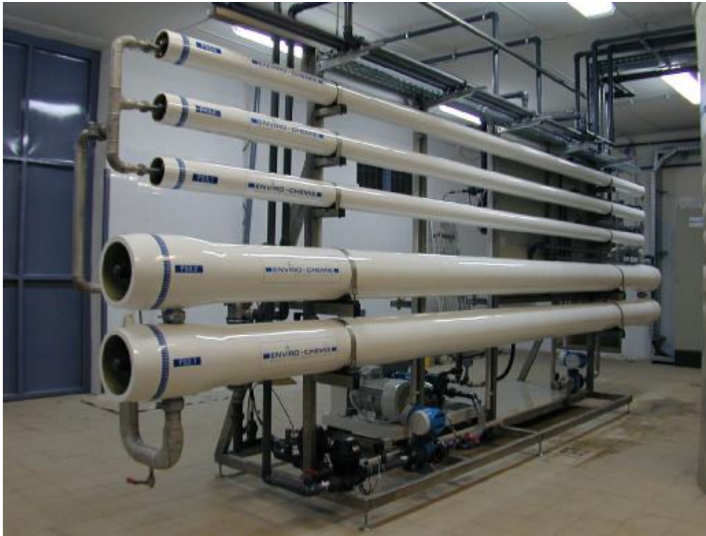
Внешний вид сооружений